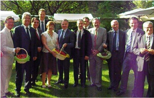
A. Delahaye et J. Rouchaussé entourant B. Accoyer, président de l'Assemblée Nationale