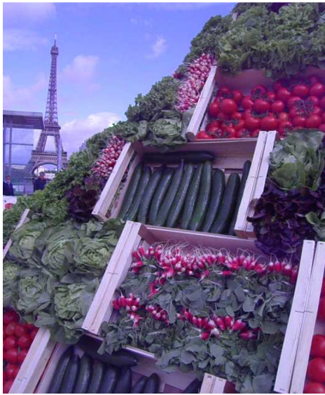
La pyramide de légumes de France sur le Champs de Mars

Réunis autour de la pyramide des Producteurs de Légumes, habillée pour l'occasion aux couleurs des tomates, concombres, salades et radis de France, la quarantaine de producteurs de tomates et de concombres de France, avec la collaboration des équipes de la Fraich'Attitude d'Interfel, ont ainsi pu sensibiliser l'opinion publique à la crise qu'ils vivaient dont l'origine reste une fausse accusation.