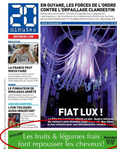
1ere page du quotidien 20 minutes